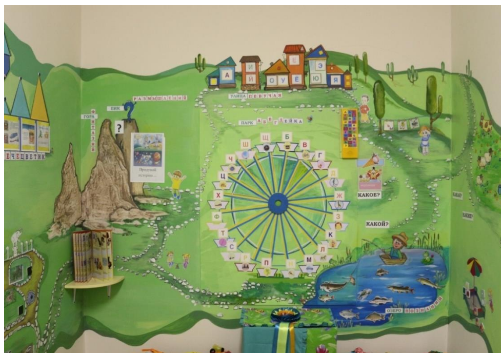
Рис. 4 «Гора «Фантазий и пик «Размышлений»