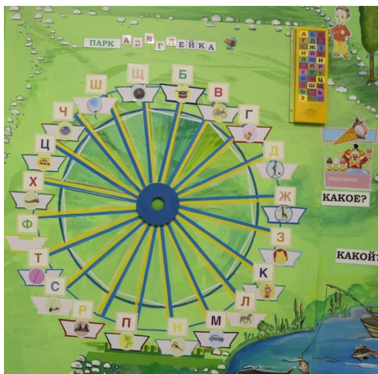
Рис. 9 «Парк АБВГДЕЙКА»