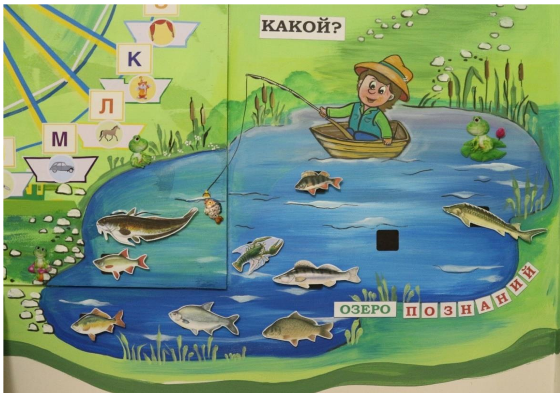
Рис. 10 «Озеро «Познаний»