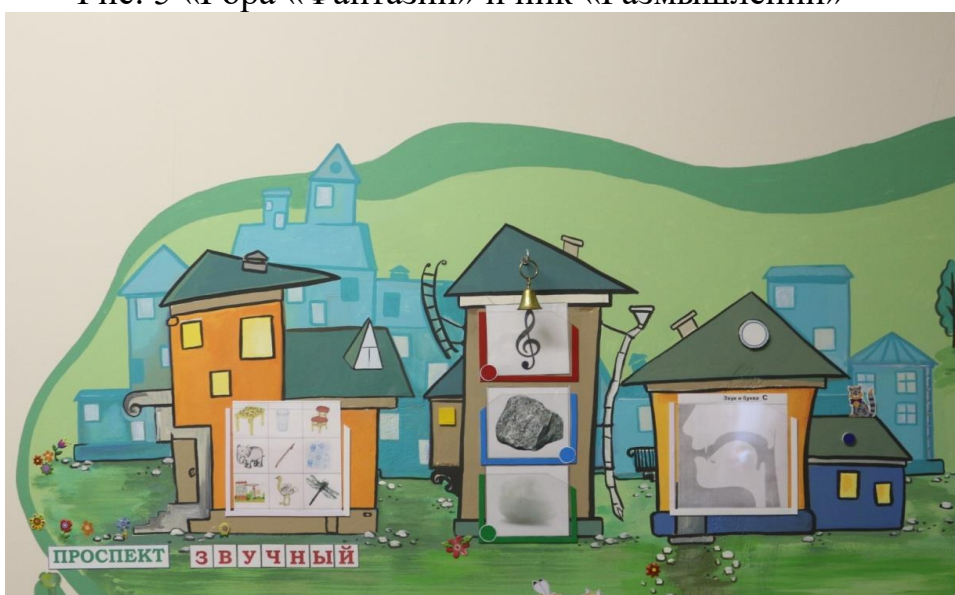
Рис. 6 «Проспект Звучный»