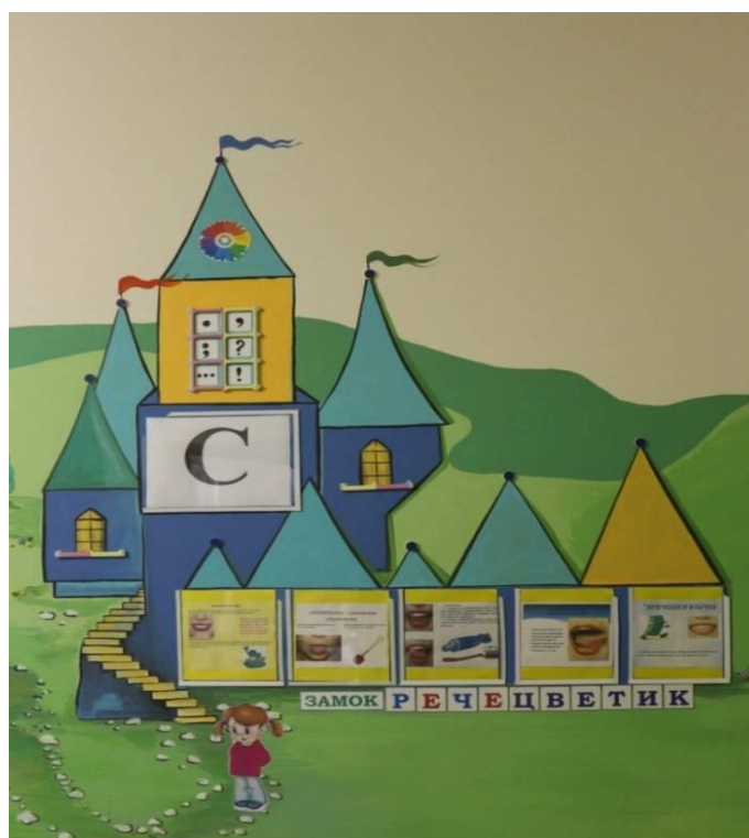
Рис. 3 «Замок «Речецветик»