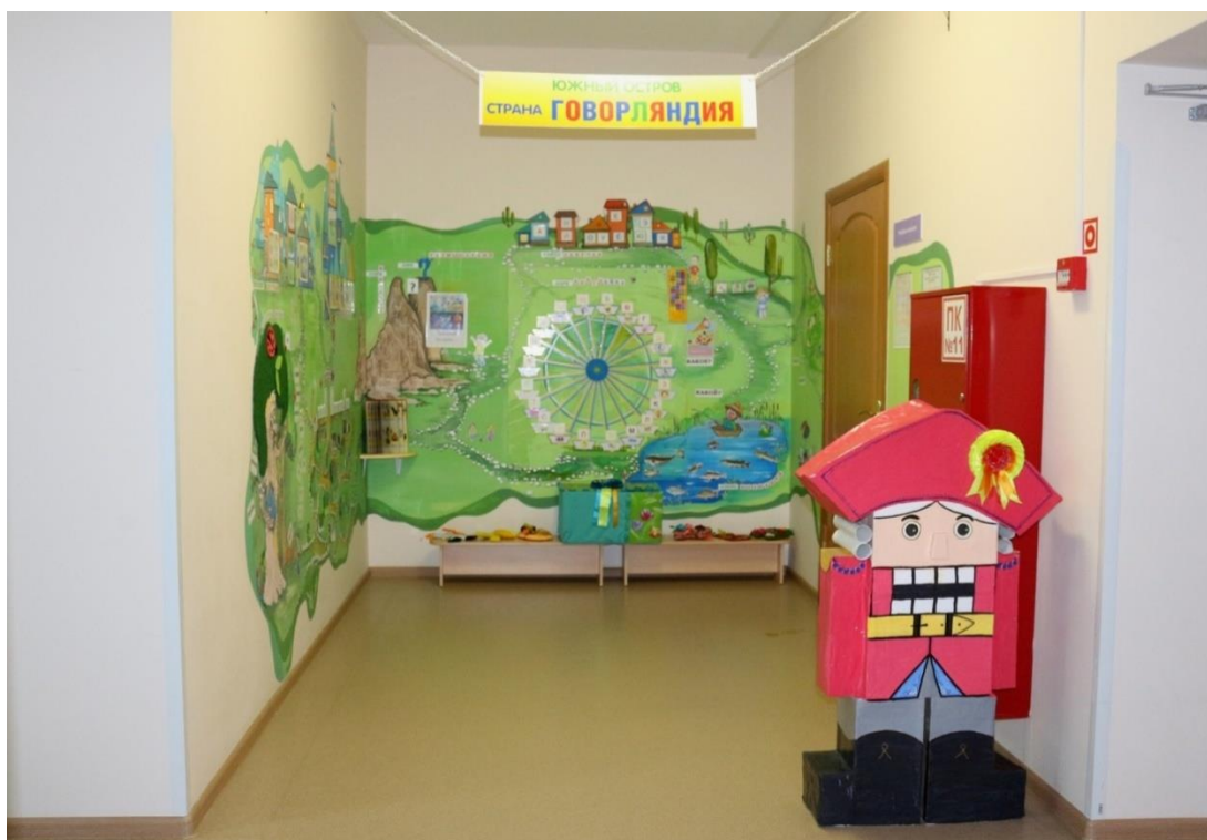
Рис. 1 «Южный остров «Говорляндия»