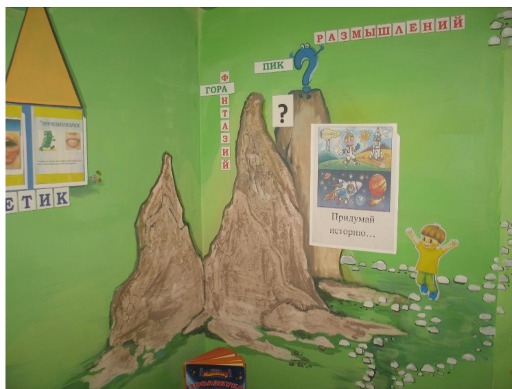
Рис. 5 «Гора «Фантазий» и пик «Размышлений»